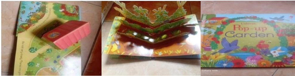
Gambar 1. Media Pop Up Book dalam pembelajaran