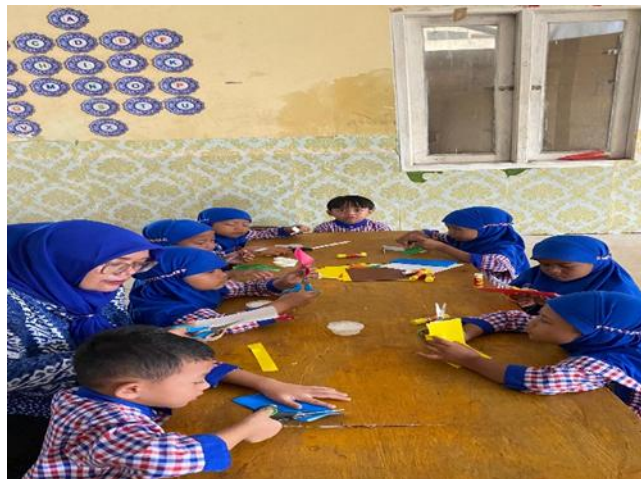
Gambar 3 Guru mendampingi kegiatan meronce

Faktor pendukung pada kegiatan meronce dengan bahan bekas di PAUD Nurul Hidayah adalah adanya media yang mudah didapatkan, anak yang aktif dan ceria sehingga kegiatan meronce dengan bahan bekas berjalan dengan efektif. Faktor penghambat pada kegiatan meronce dengan bahan bekas di PAUD Nurul Hidayah adalah masih ada anak yang belum bisa mengontrol antara tangan kanan dan kirinya, masih ada beberapa anak yang belum bisa mengikuti pola yang diberikan oleh gurunya.