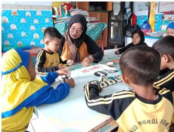
Gambar 2 Anak sedang meronce dengan bahan bekas

Namun berbeda dengan penelitian yang di lakukan oleh Batubara, (2021). Dengan judul Implementasi Kegiatan Meronce dengan Bahan Bekas Dalam Mengoptimalkan Keterampilan Motorik Halus Anak Usia 3-4 Tahun Di Ra Hikmatul Basyiroh Kota Medan (Doctoral dissertation, Universitas Islam Negeri Sumatera Utara Medan), pada penelitiannya kegiatan meronce dijadikan sebagai upaya agar dapat meningkatkan kemampuan seni pada diri anak. hasil penelitiannya mengungkapkan bahwa dalam kegiatan pembelajaran meronce dapat meningkatkan eksplorasi, apresiasi, ekspresi anak pada kemampuan seni anak usia dini.