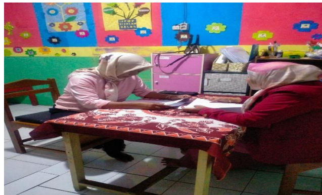
Gambar 2 Wawancara Dengan Orangtua Sebagai Bentuk Kolaborasi

Orang tua yang konsisten memberikan arahan dan membiasakan aturan yang sama setiap hari akan mempercepat proses pembentukan moral. Konsistensi menjadikan anak memahami mana perilaku yang bisa diterima dan mana yang tidak.