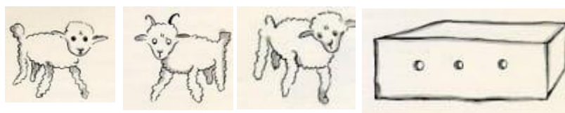
Gambar 2: Domba dalam Kotak

Ilustrasi domba dalam kotak menampilkan kotak persegi sederhana dengan garis hitam yang sedikit tidak rata, dihiasi tiga lubang kecil sebagai ventilasi, tanpa kehadiran domba secara literal. Latar putih polos dan tekstur akvarel yang ringan menciptakan kesan intim, mengundang pembaca untuk mengisi kekosongan dengan imajinasi mereka sendiri (Kennedy, 2020). Secara denotatif, ini hanyalah kotak, tetapi narasi teks mengungkapkan bahwa sang pangeran menerima kotak ini sebagai representasi domba, menyoroti kekuatan imajinasi anak (Barthes, 2017). Teks berfungsi sebagai relay, memperluas makna visual ke tema kreativitas dan tanggung jawab.