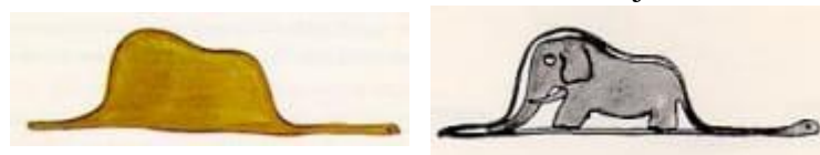
Gambar 1: Ular Boa Menelan Gajah

Ilustrasi ular boa menelan gajah menampilkan garis-garis hijau tebal yang sedikit bergetar, membentuk tubuh ular dengan benjolan bulat yang menyerupai gajah, pada latar putih polos. Tekstur akvarel yang lembut dan perspektif dua dimensi menciptakan kesan spontan, seolah digambar oleh anak yang penuh imajinasi (Kennedy, 2020). Secara denotatif, ini adalah gambar ular yang menelan gajah, tetapi narasi teks mengungkapkan bahwa orang dewasa salah mengira gambar ini sebagai topi, mengkritik keterbatasan