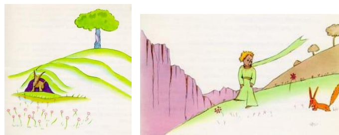
Gambar 5: Rubah

Ilustrasi rubah, dengan garis sederhana dan warna kuning cerah, memancarkan kehangatan yang ramah pada latar putih polos. Tekstur akvarel dan ekspresi rubah yang lembut menciptakan kesan intim (Kennedy, 2020). Secara denotatif, ini adalah rubah, tetapi narasi tentang “menjinakkan” mengarahkan makna ke persahabatan dan tanggung jawab emosional (Barthes, 2017). Teks berfungsi sebagai relay, memperluas makna visual ke tema dewasa.