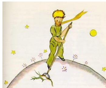
Gambar 4: Planet Sang Pangeran

Planet sang pangeran, digambarkan dengan garis kuning-hijau lembut dan figur pangeran sebagai pusat, menghadirkan dunia kecil yang intim. Tekstur akvarel dan skala kecil planet menciptakan kesan rapuh namun penuh harapan (Kennedy, 2020). Secara denotatif, ini adalah planet kecil dengan penghuni tunggal, tetapi narasi teks mengarahkan makna ke tema kesepian dan identitas (Barthes, 2017). Teks berfungsi sebagai anchorage, mengundang refleksi eksistensial.