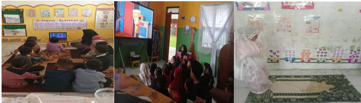
Tabel 4. Kondisi Karakter Religius Anak Siklus II