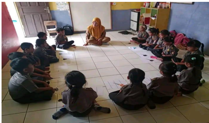
Gambar 1 Penerapan Stimulasi Motorik Halus

Pada pertemuan pertama guru mempersiapkan kebutuhan anak sesuai jumlah anak, anak diajak untuk berdoa sebelum melakukan kegiatan, bernyanyi untuk membangun suasana yang menyenangkan dan kondusif. Guru mulai mencontohkan kegiatan yang akan di lakukan, guru terus menerus mengawasi dan melakukan pendekatan kepada anak.