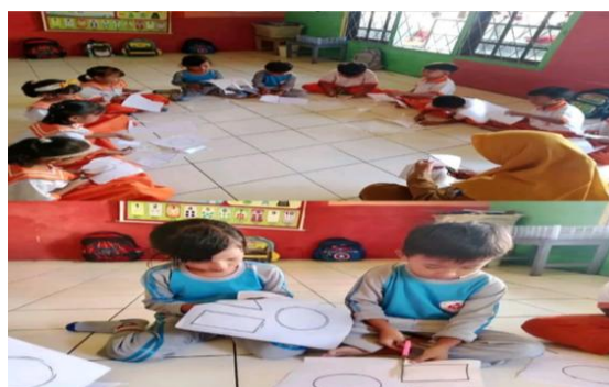
Gambar 3 kegiatan anak menggunting

Pertemuan ke 3 guru mempersiapkan gunting sesuai jumlah anak dan kertas yang sudah berbagai macam pola seperti lingkaran, segitiga, dan persegi. Guru memimpin anak membaca doa terlebih dahulu sebelum melakukan kegiatan, membangun suasana menyenangkan dengan mengajak anak bermain Puzzle yang berbagai macam bentuk dan ukuran anak sangat antusias dan tidak sabar untuk melakukan kegiatan menggunting. Kekuatan antara jari-tangan dan konsentrasi semakin meningkat dan menjukan keterampilanya dalam menggunakan gunting dengan baik dan benar, dengan pola yang bervariasi anak mengetahui berbagai macam bentuk dan ukuran.