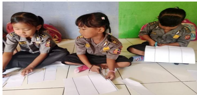
Gambar 2 kegiatan anak menggunting

Koordinasi : pada minggu ke dua koordinasi antara mata-tanga sudah mulai menunjukkan peningkatan dan kefokuskan dalam menyelesaikan tugas anak mampu sabar, konsentrasi dan teakanan menggunting sudah mulai terlihat