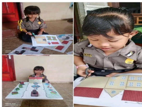
Gambar 5 Kegiatan Menggunting Berbagai Macam Bentuk Dan Ukuran

Selain observasi peneliti juga melakukan dokumentasi berupa photo atau gambar saat melakukan kegiatan menggunting, dalam koordinasi mata-tangan dengan berbagai macam bentukukuran dan beraneka warna dan kretivitas dapat di lihat pada gambar :